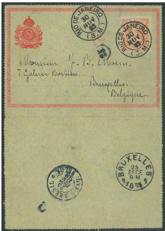
Carta-bilhete precursora (CBP) enviada para a Bélgica, em 1883. Única peça conhecida desta emissão, circulada para o exterior, tendo por destinatário o filatelista J. B. Moens, primeiro editor de catálogos de selos no mundo.

Essa modalidade de peça filatélica comporta, porém, muitas formas possíveis empregadas pelo mundo afora e também no Brasil. São envelopes, bilhetes postais, cartas-bilhetes, cintas etc. E é no capítulo das cartas-bilhetes que se encontram algumas das grandes raridades da filatelia brasileira, como a peça ilustrada abaixo.